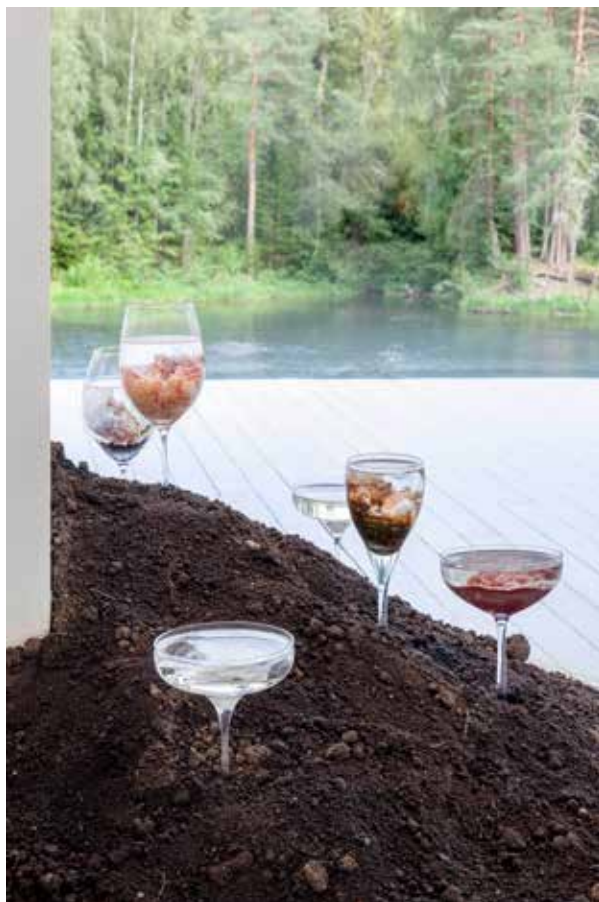
Ил. 3. Ане Графф. Кубки. 2021. Смешанная техника. Частная коллекция

кубок в образе аутоиммунной патологии (например, болезнь Альцгеймера, болезнь Паркинсона, рассеянный склероз, псориаз, фибромиалгию), на которую, вероятно, эти вещества повлияли.